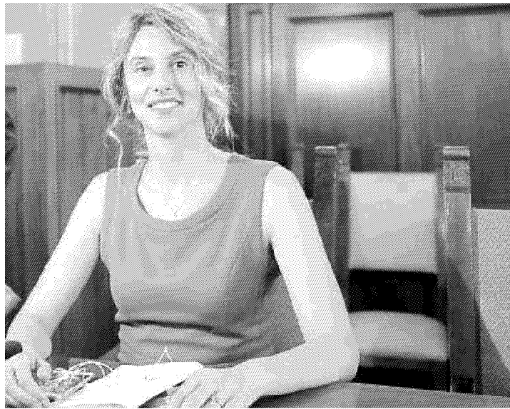
Il ministro Marianna Madia